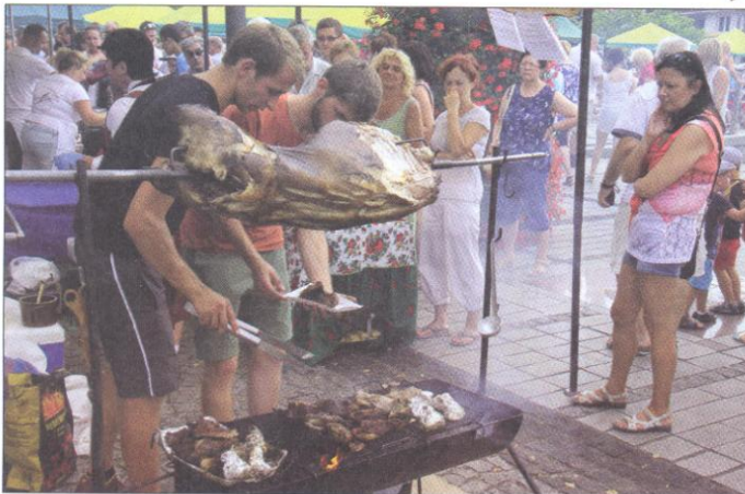
W tym roku baraniny nie zabrakło.