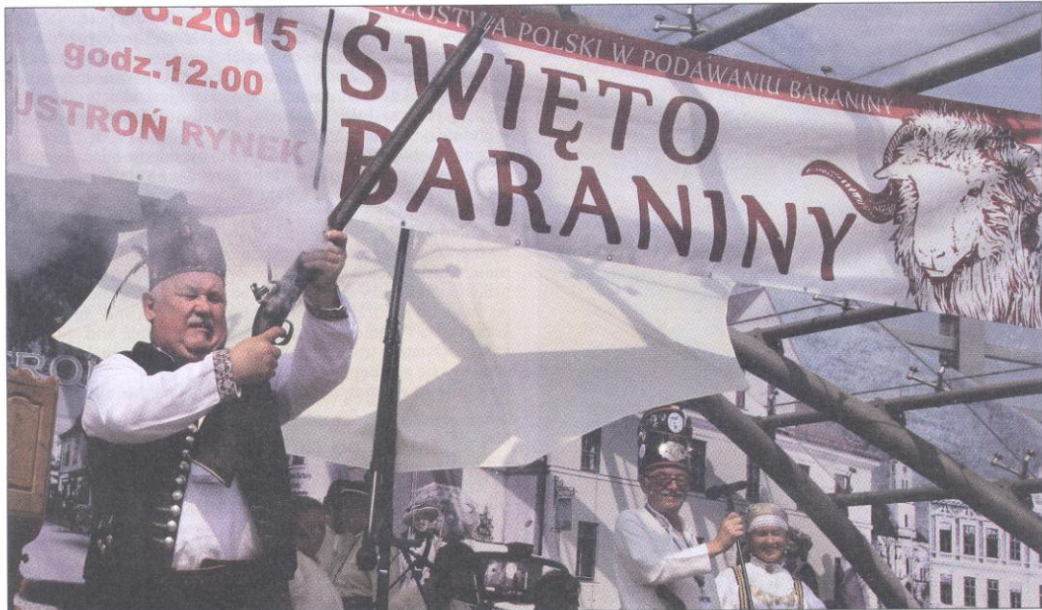
Wystrzały na otwarcie Święta Baraniny. Więcej na str. 13.

Nr 33 (1233) 20 sierpnia 2015 r. 2,10 zł (w tym 5% Vat) Nakład: 1250 egzemplarzy ISSN 1231-9651