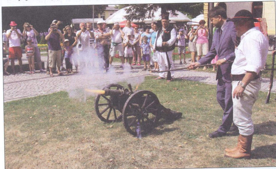
Na zakończenie uroczystości oddano salut armatni.